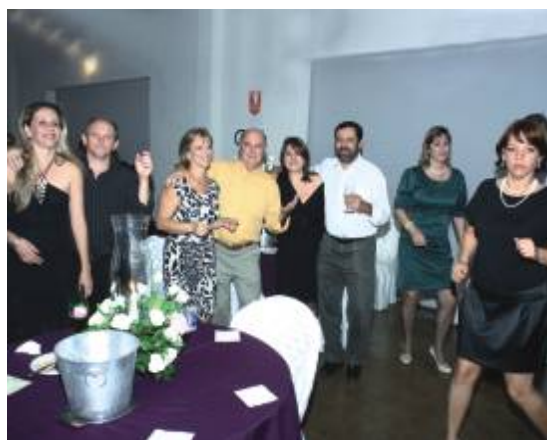
Grupo animado de participantes da região