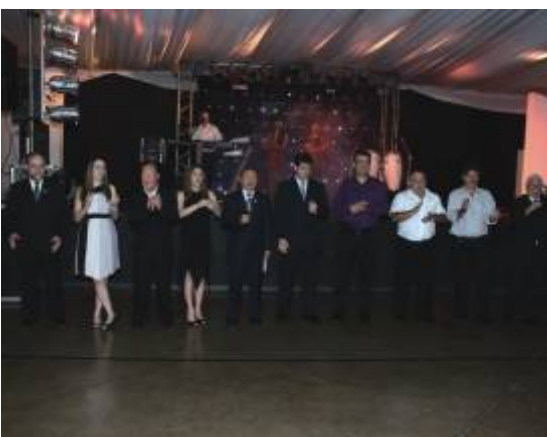
Diretoria reunida na hora dos parabéns.