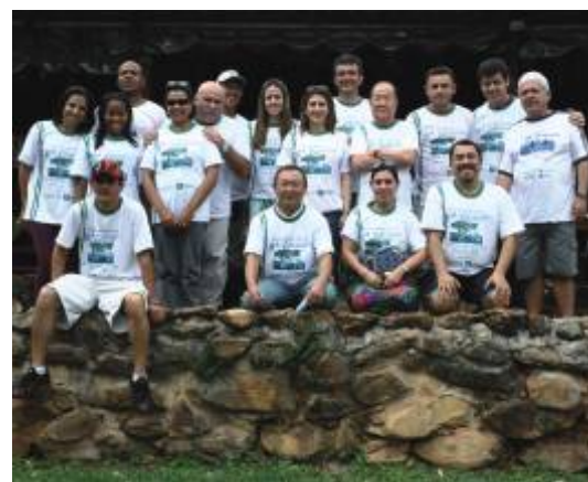
No dia seguinte, o passeio à Fazenda Jaborandi