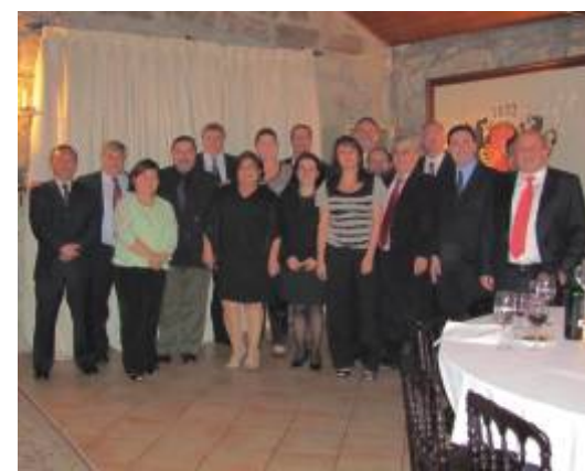
Delegação brasileira no Jantar de Gala oferecido aos participantes do Congresso.