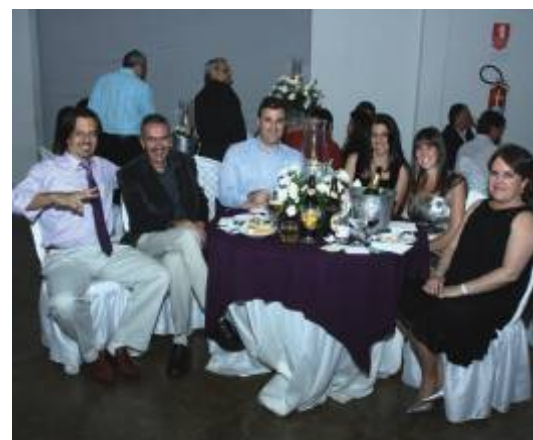
Nas mesas também a animação era geral