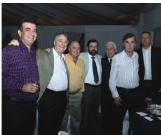
Personalidades da esfera política e social de Franca presentes à festa

No dia seguinte ao baile, os visitantes ainda foram levados ao tradicional Shopping do Calçado de Franca e almoçaram na Fazenda Jaborandi, no encerramento da Cavalgada em Comemoração ao Dia da Árvore. Só então retornaram para São Paulo, chegando no sábado à noite, com a lembrança de terem vivido mais um grande momento oferecido pela AESabesp.