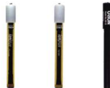
FLUORETO NITRATO AMÔNIA

Técnicas reconhecidas mundialmente (EPA - Standard Methods - Pharmacopeia e outros).