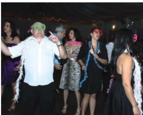
Na pista, boa música e adereços coloridos