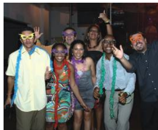
Equipe da MS, de São Paulo, levou o seu prestígio à festa.