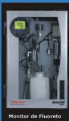
Monitor de Fluoreto