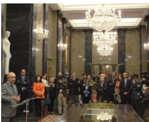
O Presidente da Câmara Municipal do Porto, Rui Rio, realizou a solenidade de boas vindas.

Após cada explanação, formulamos o convite para que cada entidade contatada inscrevesse seus trabalhos para serem apresentados no próximo Encontro Técnico de 2011, com o intuito de promover a aproximação dos países de língua portuguesa e permitir aos técnicos da Sabesp conhecer a realidade desses países e no que concerne ao futuro que todos poderão estar compartilhando, na busca de soluções para um mundo melhor.