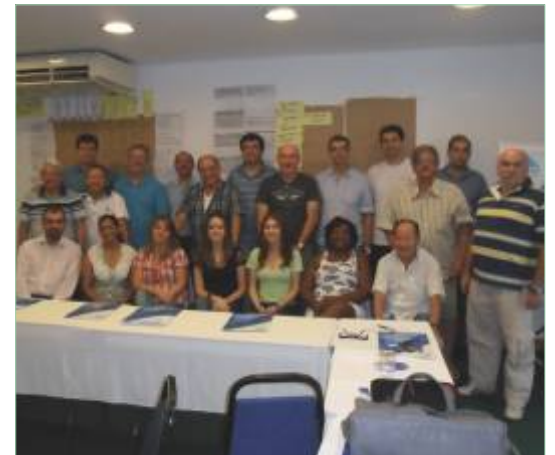
Grupo de diretores e coordenadores participantes do PES