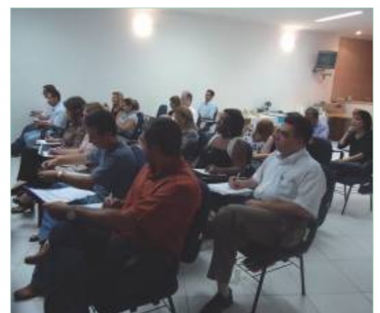
Platéia ficou envolvida com o tema