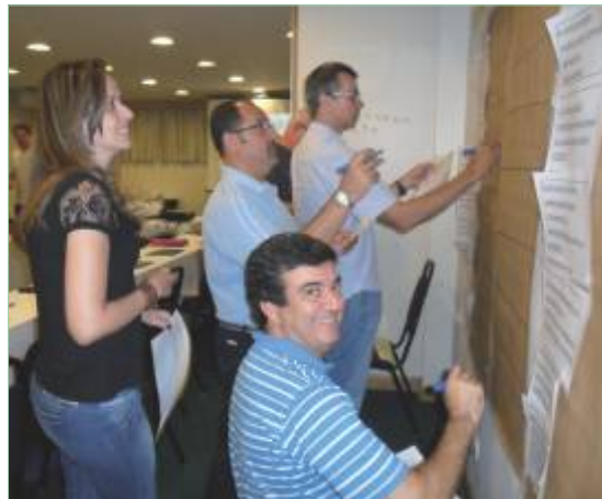
Componentes do PES em fixação de suas metas