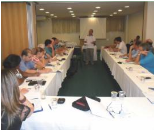
Abertura dos trabalhos com os cumprimentos do presidente

"Em 2013, a AESABESP quer ser reconhecida como referência de organização social que promove soluções socioambientais".