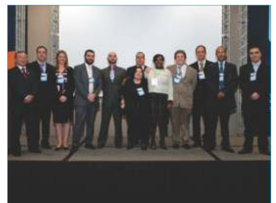
-Comissão da premiação 2012