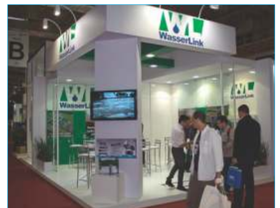
- Wasserlink - Projetos e Instalações Comissão Avaliadora do Prêmio 2012