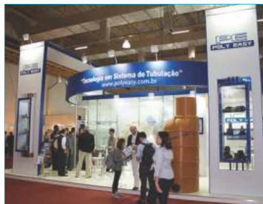
-Poly Easy Comercial