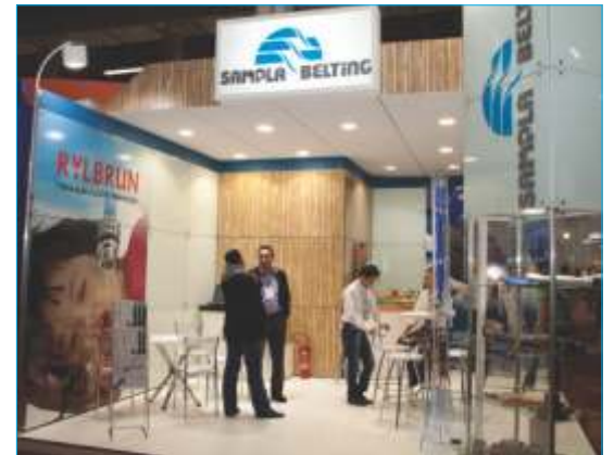
-Sampla do Brasil