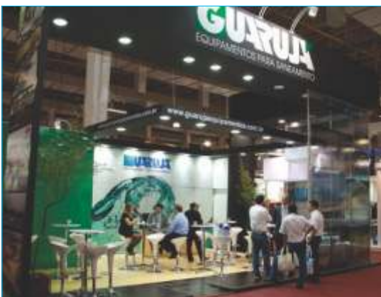
-Guarujá Equip. para Saneamento