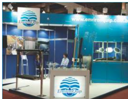
-Environquip- Eng. de Sist. Ambientais Destaque AESabesp - Encontro Técnico