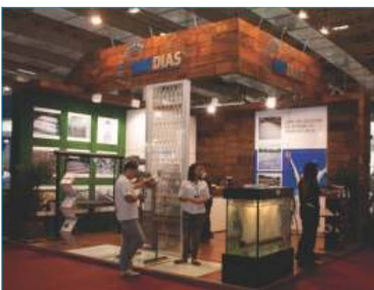
- B&F Dias