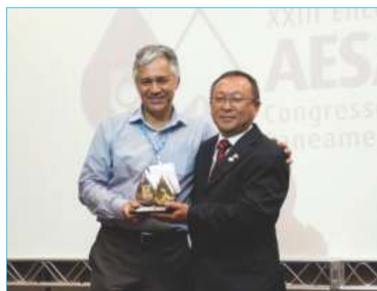
-UN Metropolitana Leste da Sabesp