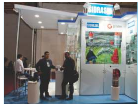
-Sidrasul - Sistemas Hidráulicos