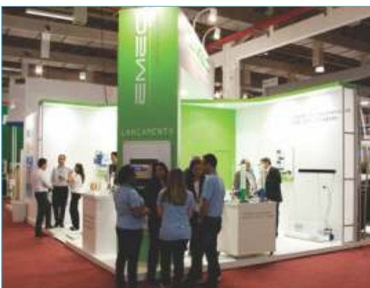
-Emec Brasil- Sist. de Trat. de Água "Destaque AESabesp – Fenasan 2012"