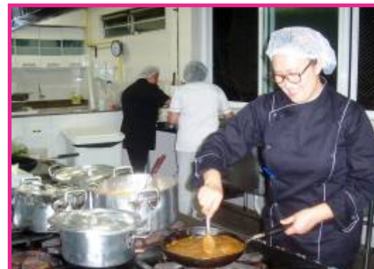
O momento do preparo dos pratos exóticos que compuseram o cardápio da noite desse singular evento gastronômico.