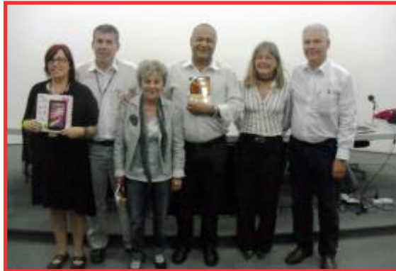
AE, APU e Associação Sabesp em parceria nesse evento