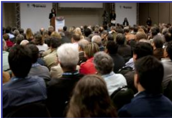
Encontro de Fornecedores em 2012