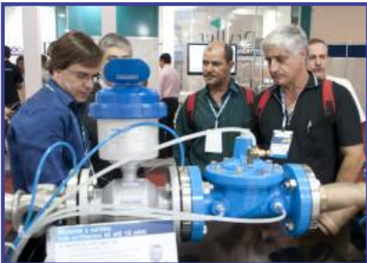
Demonstração de expositores na Feira

- Nos dias 30 e 31 de julho e 01 de agosto, os congressistas e visitantes do evento poderão utilizar as Vans oferecidas gratuitamente pela AESabesp, que serão colocadas na Estação Tietê do Metrô, ininterruptamente das 8 às 20 horas.