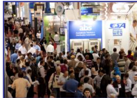
Grande concentração de público em 2012