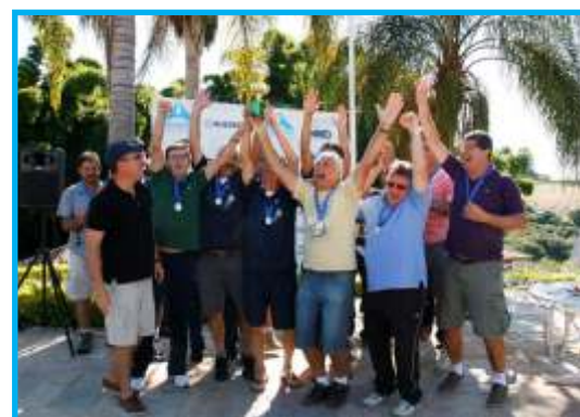
A vitoriosa equipe do Vale do Paraíba tetracampeã em 2013