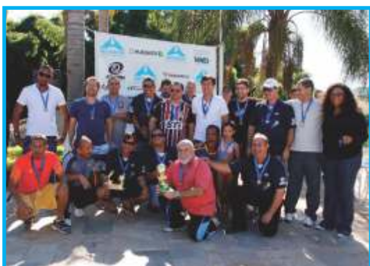
A animada equipe da Metropolitana Leste 3ª colocada