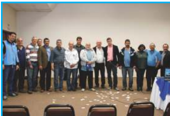
Diretores e coordenadores de Polo da AESabesp levaram o seu prestígio ao grande evento