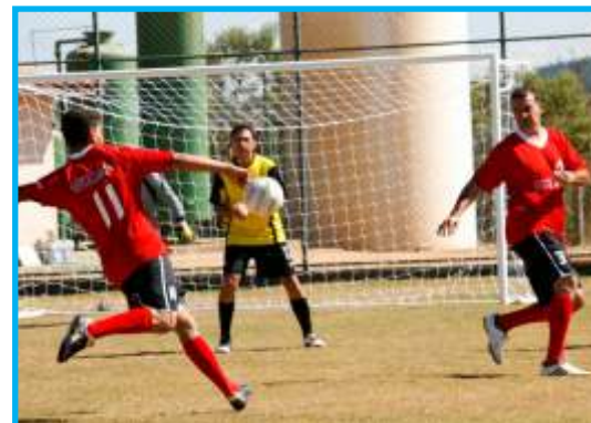
A arte do futebol mobilizou todas as equipes, tanto com belos passes em campo quanto com a animação das torcidas