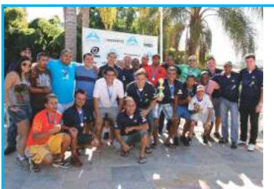
A brava equipe da Metropolitana Sul vice-campeã