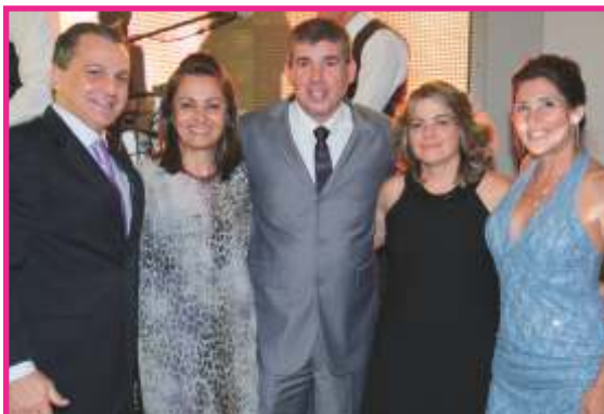
O casal Pladevall (presidente da APECS) com os anfitriões da noite