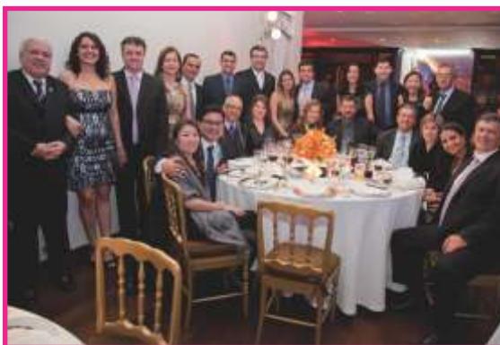
Caravana de Franca trouxe o seu prestígio para São Paulo