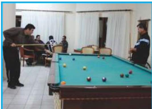
Além de Futebol, foram disputadas partidas de Sinuca, Tennis de Mesa, Dominó e Truco