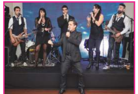
A animada e elogiada banda "São Paulo Show"