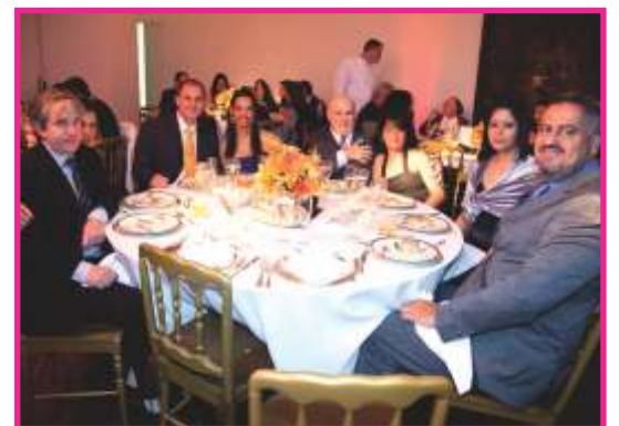
Amigos da Metropolitana Leste também marcaram presenças.