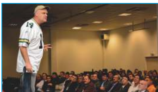
Auditórios lotados para a palestra de Oscar Schmidt

A exemplo do que ocorre em todos os anos nesse evento, que traz os maiores palestrantes do País para o seu público, no final da tarde de 30 de julho, os auditórios do Congresso foram todos abertos, para formar um espaço magno para comportar o grande público da palestra aberta de encerramento do primeiro dia do Congresso, denominada “Obstinação”, ministrada, com muita propriedade, pelo atleta mundialmente consagrado Oscar Schmidt. O local ficou completamente lotado. Com uma apresentação vibrante que caracteriza sua personalidade, Oscar abordou suas conquistas e mostrou cenários de sua trajetória no esporte, para exemplificar valores de vida pautados em ações, como: Visão, Decisão, Obstinação e Paixão. O ponto alto foi a exibição de um vídeo do jogo histórico entre o Brasil e os EUA, no qual a seleção brasileira reverteu um placar com 20 pontos de diferença e ganhou o título de campeão panamericano.