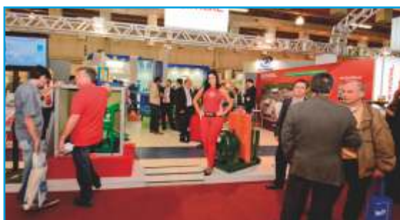
Aprovação dos expositores

Os expositores estavam satisfeitos com o alcance da Feira, inclusive no volume de contatos gerados em seus três dias de realização e com o alto nível técnico dos participantes.