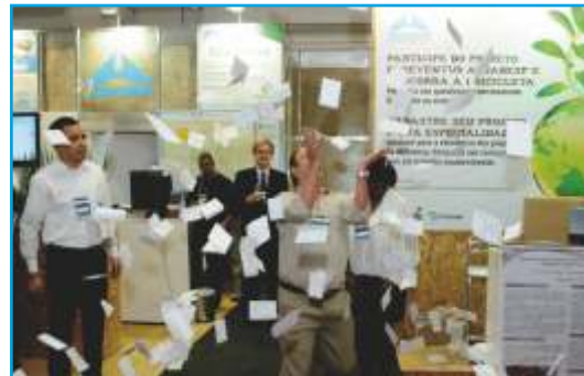
Premiações do estande AESabesp

No estande da AESabesp foram iniciadas várias ações voltadas aos associados e participantes da Feira, que resultou na entrega de vários prêmios, como tablets, livros e bicicleta.